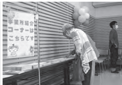
▲福祉相談ブース&事業所紹介コーナー