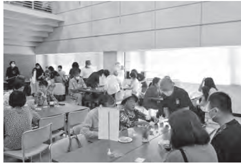
▲福祉カフェの様子

第一部の、福祉カフェ、福祉相談ブース&事業所紹介コーナーには約80名の方にご来場いただきました。