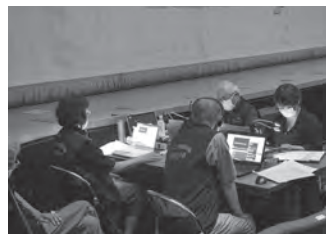
▲パソコン要約筆記

第二部は、町内の福祉向上に功績のあった方々を表彰させていただいた後、手話サークル「泉の会」の皆さんのご指導のもと、音楽「さんぽ」に合わせて会場の皆さんで手話コーラスを行いました。