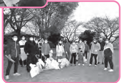
▶清水公園 ゴミ拾い