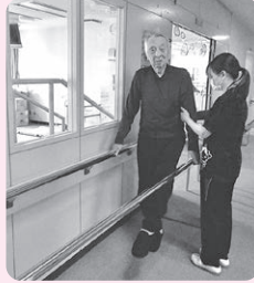
▲平行棒体操の様子