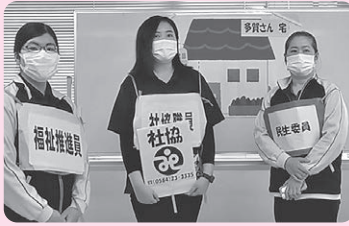
▲寸劇動画の一コマ

社協から少人数で行っている別のサロンを紹介してもらい、新しいサロンに参加されるようになりました。