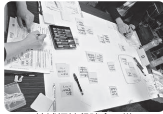
▲地域福祉懇談会の様子

町民の皆様がより暮らしやすくなるよう、今後とも福祉活動事業をはじめ、様々な事業を展開してまいりますので、ご理解とご協力をよろしくお願いたします。