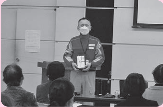
▲団員の皆さんが救援金を集め寄附されました