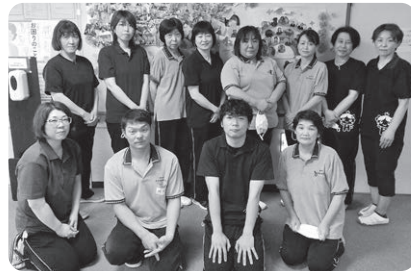
▲デイサービスセンター職員

垂井町デイサービスセンターでは、利用者さんの笑顔があふれるような空間づくりを心がけた運営を行っております。そのため健康体操やレクリエーション、季節行事など、利用者さんが笑顔になれるような活動や行事を企画しております。 また、新型コロナウイルス感染症収束の目処が立たない中、利用者さんの安全を第一に考え、予防対策の徹底に努めております。 今回は、利用者さんにお過ごしいただく1日のスケジュールを紹介いたします。