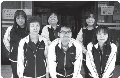
▲居宅介護支援事業所職員