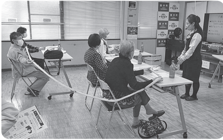
◀お話を聞く参加者の皆さんの様子