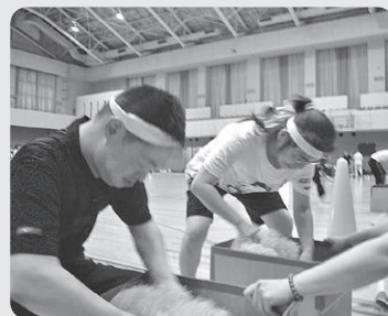
▲ふれあい交流会(運動会)