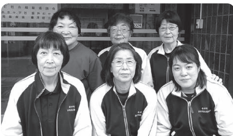
▲訪問介護事業所職員