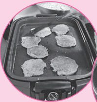
お好み焼き 焼きそばの準備