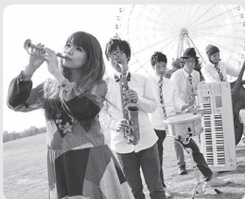
▲ジャズバンド【ラブル☆】様