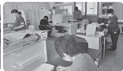
▲けやきの家利用者さん