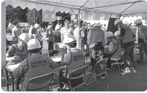
▲災害ボランティアセンター設置運営訓練の様子