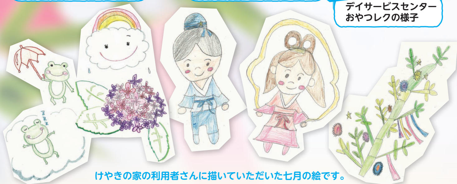
けやきの家の利用者さんに描いていただいた七月の絵です。