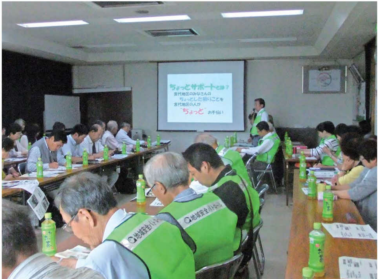
宮代地区で展開されている生活支援活動「宮代地区ちょっとサポート」活動の視察研修のため、桑名市在良地区社会福祉協議会の皆さんがいらっしゃいました。（6月12日、宮代地区まちづくりセンター）