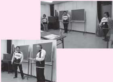
社協職員による寸劇