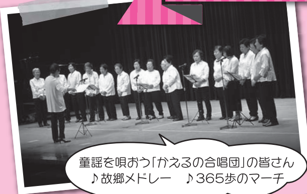
童謡を唄おう「かえるの合唱団」の皆さん ♪ 故郷メドレー ♪ 365歩のマーチ