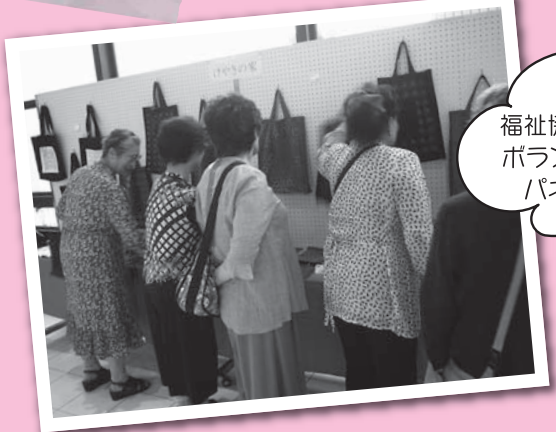
福祉協力校、福祉施設、ボランティア団体等の パネル&作品展示