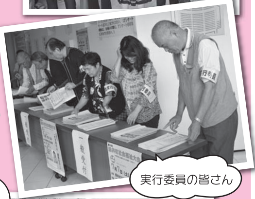
実行委員の皆さん