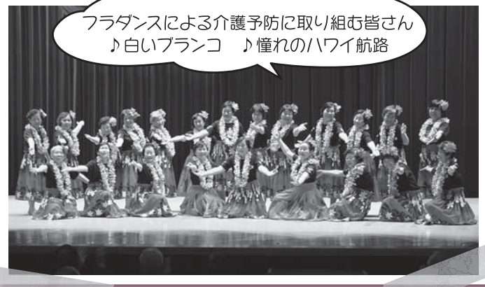
フラダンスによる介護予防に取り組む皆さん ♪ 白いブランコ ♪ 憧れのハワイ航路