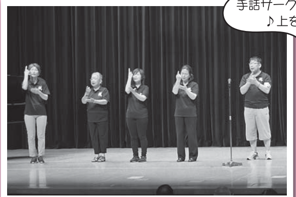
手話サークル・泉の会の皆さん ♪ 上を向いて歩こう