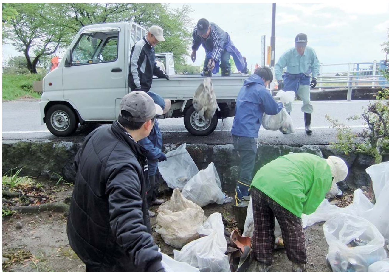
表佐地区で開催されている生活支援活動「表佐地区ちょっとサポート」のサポーターによる相川堤防クリーン活動（4/18）の様子。