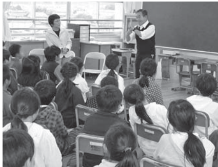
福祉協力校での福祉学習

5月17日、本会が指定する福祉協力校の小・中学校、高校の福祉担当者にご参加いただき、福祉学習や福祉活動等に関して情報交換や意見交換を行っていただきました。 各校とも地域に根ざしたボランティア活動や、福祉の感情を育むための様々な活動や学習を展開されているとのことでした。 社会福祉協議会では、各校で進められている福祉活動や福祉学習を今後とも支援してまいります。