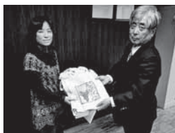
不破高等学校家庭クラブの皆さんから高齢者の方にとトートバッグをたくさんいただきました。