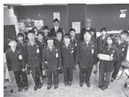
垂井小学校の児童の皆さんから福祉に役立ててくださると寄付金をいただきました。