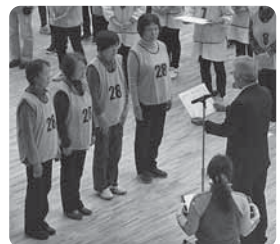
サファイヤ・チームの皆さん