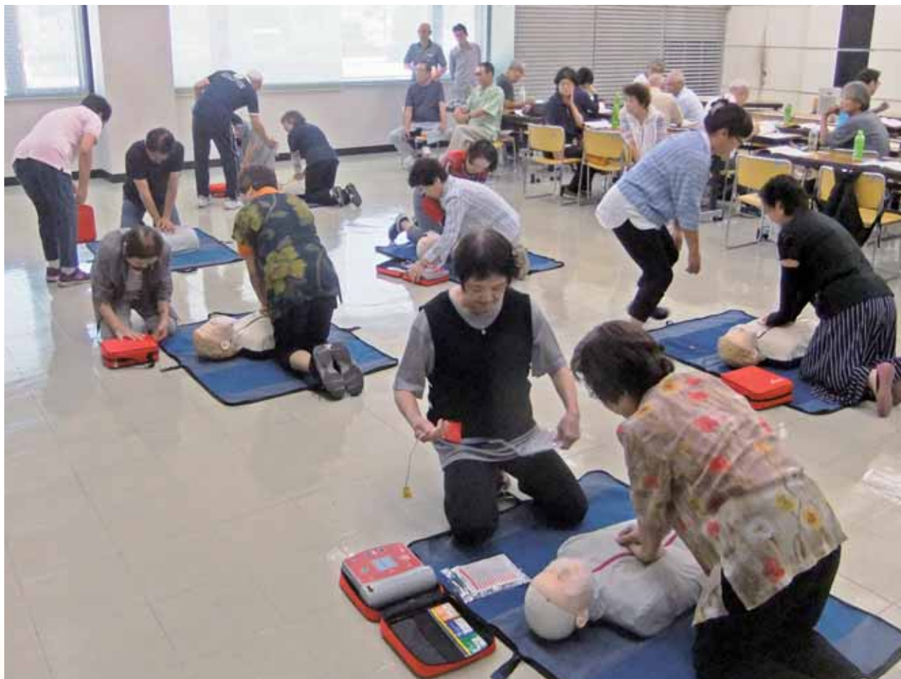
平成29年度災害ボランティアコーディネーター養成講座にて一次救命処置について学ばれる受講者