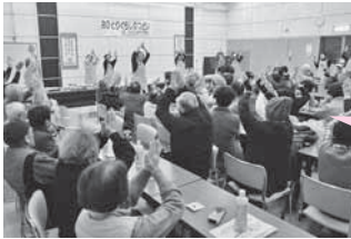
ビンゴやレクリエーションで会場を盛り上げるつばき会の皆さん