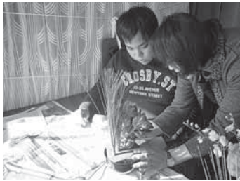
思い思いの作品づくり

その後、おいしいお菓子とお抹茶をいただき、センターのみなんで楽しいひとときを過ごしました。 ※この事業は、歳末たすけあい募金の配分を受けて開催しました。