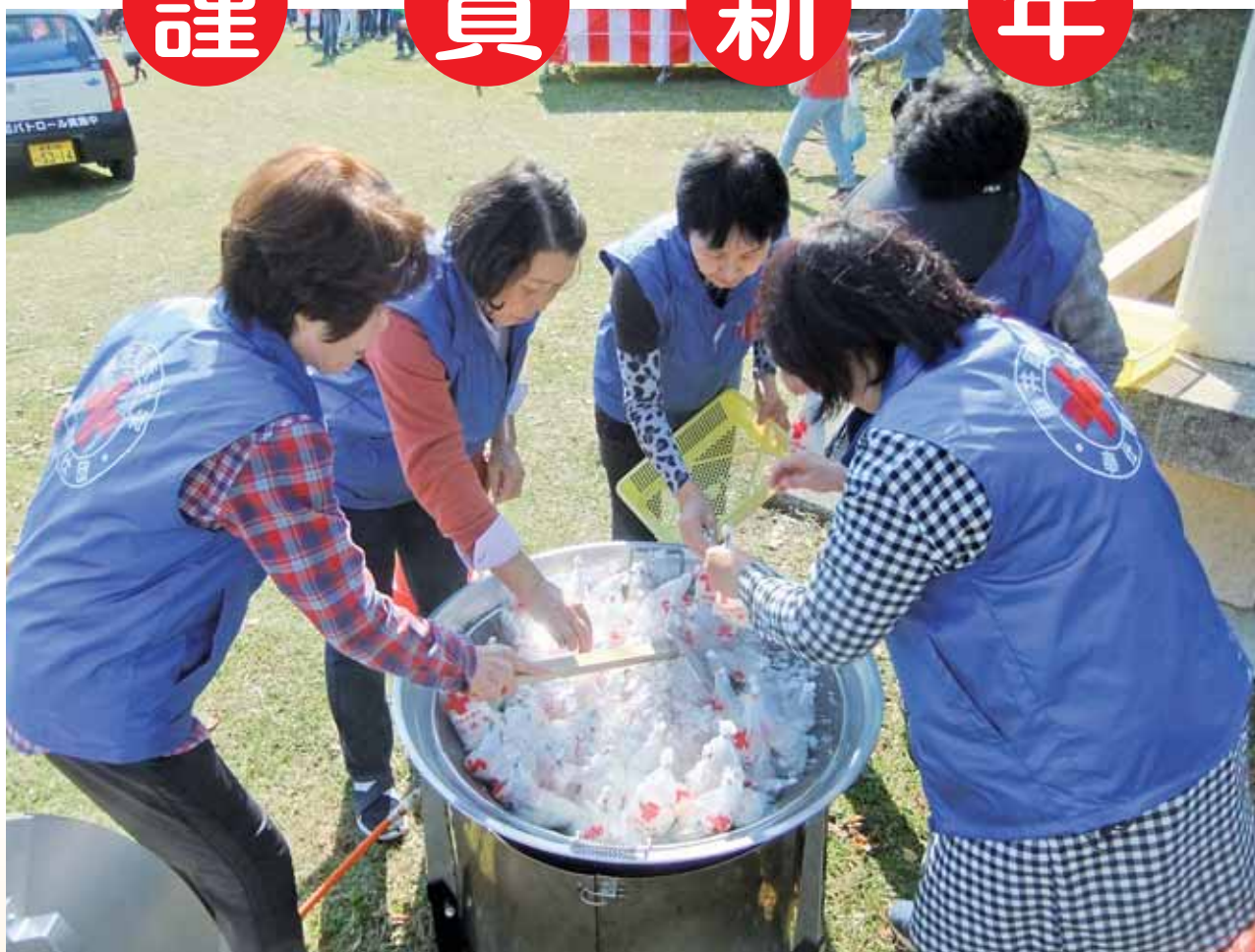
ふれあい垂井ピア2017におけるハイゼックスを使用した非常食炊き出しの実演