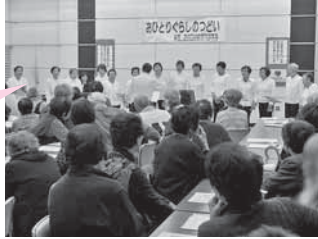
懐かしい童謡を披露される「童謡を唄おう」の皆さん