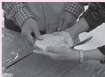
新聞スリッパを作ろう！