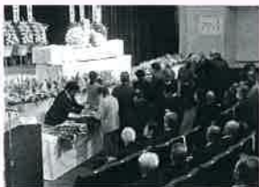
参列者による献花

今や、戦後70年以上が経ち、戦後生まれの世代が、日本の人口の八割を超えています。本会では、皆様とともに、薄れつつある戦争の記憶を新たに、平和で誰もが住み慣れた地域で自立した生活ができるよう、地域福祉が充実したまちづくりを引き続き進めて参ります。今後ともご協力をお願いします。