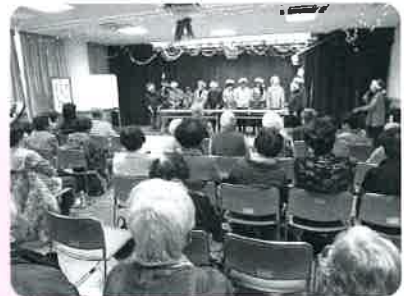
各地区いきいきふれあいサロン(表佐)