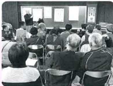
各地区いきいきふれあいサロン(垂井)