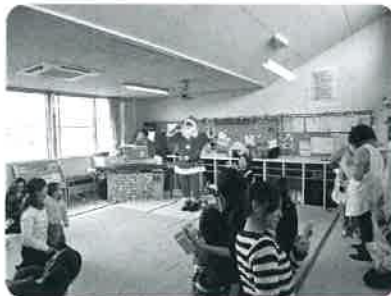
子育てふれあいサロン クリスマス会