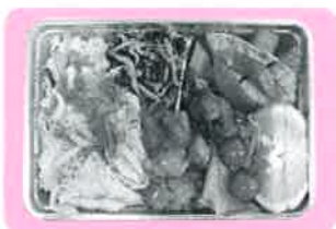
できあがったお弁当