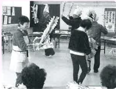
各地区民生委員によるつどい(宮代)