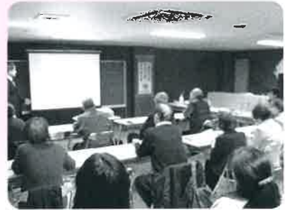
在宅介護者のつどい