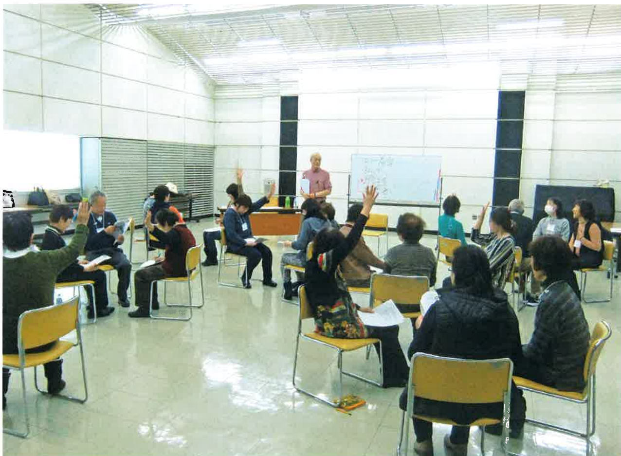
傾聴ボランティア・スキルアップ講座の様子