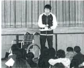
▲岩手小学校(車いすの使い方について)