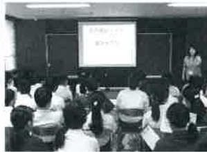
▲垂井小学校(高齢者が住みやすいまちづくりについて)