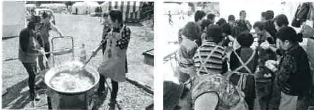
非常食（ハイゼックスやアルファ米）の実演

11月5日から6日にかけて朝倉運動公園で開催された「ふれあい垂井ピア2016」に出展し、垂井町ボランティア連絡会の皆さんの協力のもと、ご来場されたたくさんの方々にブースにお寄りいただきました。