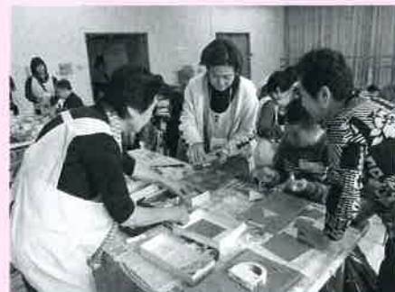
牛乳パックを使って小物を作りました。

体験 「小物づくり ～牛乳パックでつくりましょう～」 講師 コミュニティママの皆さん