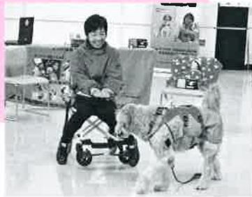
介助犬PR犬によるデモンストレーション