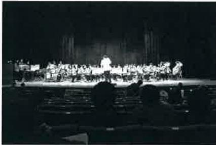
大垣女子短期大学ウインドアンサンブルの 皆さんによる素晴らしい吹奏楽で幕開け

11月20日(日)、町文化会館において、障がいのある人もない人も一堂に集い、交流を深めながら、障がいについて理解を深め、地域の誰もが安心して暮らせるまちづくりをすすめていくことをめざして「第2回たるいふれあいのつどい」を開催いたしました。 オープニングの大垣女子短期大学ウインドアンサンブルの皆さんによる吹奏楽を楽しんでいただいた後、3つの分科会に分かれて、障がいについての理解を深めたり、参加者で交流していただきました。 また、会場内に障がい施設製品販売コーナーや町健康福祉課にご協力いただいて障害福祉制度相談コーナーも設け