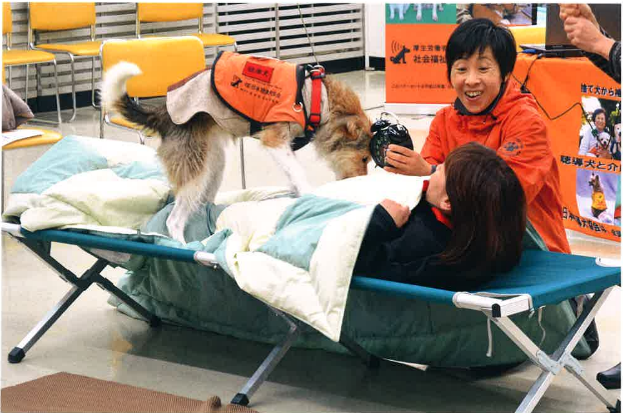
「聴導犬のお仕事を学ぼう！」で行われた聴導犬PR犬による目覚ましのデモンストレーションの様子 (目覚まし時計の音を聴いた聴導犬が要介助者を目覚ます様子です。)