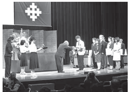
表彰式。当日は、不破中学校と北中学校の生徒さんにボランティアとしてお手伝いいただきました。