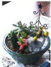
思い思いの寄せ植えづくり

また、季節感たっぷりのお菓子と抹茶も楽しまれ、なごやかなひとときとなりました。この事業は、歳末たすけあい事業配分金などにより開催しました。