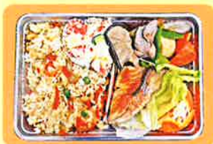
できあがったお弁当

給食ボランティアには、 ・調理ボランティア ・配食ボランティア のふたつがあります。 現在どちらのボランティアも募集しております。 詳しくは、垂井町社会福祉協議会(☎23-3335)までお問い合わせください。