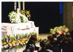
参列者による献花

今や、戦後70年以上が経ち、戦後生まれの世代が、日本の人口の八割を超えています。本会では、皆様とともに、薄れつつある戦争の記憶を新たに、平和で誰もが住み慣れた地域で自立した生活ができるよう、地域福祉が充実したまちづくりを引き続き進めて参ります。今後ともご協力をお願いします。