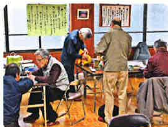
おもちゃ治療中の様子