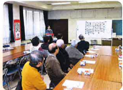
各地区いきいきふれあいサロン(宮代)