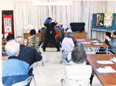
各地区民生委員によるつどい(岩手)