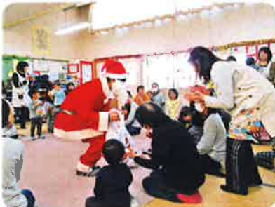
子育てふれあいサロン クリスマス会