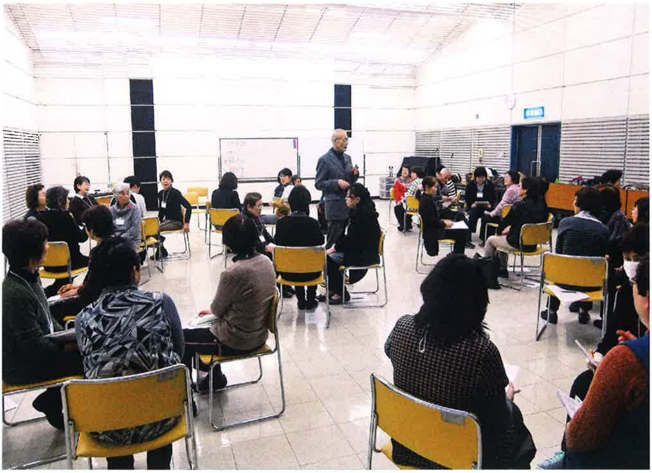
平成27年度傾聴ボランティア養成講座の様子