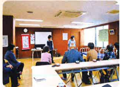
在宅介護者のつどい