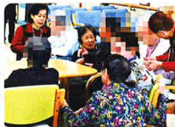
傾聴ボランティア活動の様子

本会が主催した傾聴ボランティア養成講座を受講された皆さんが、ボランティアグループ「傾聴ボランティア・ききょう」を立ち上げ、町内施設などで活動を展開されています。