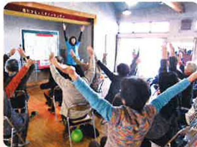
各地区いきいきふれあいサロン(駒引)