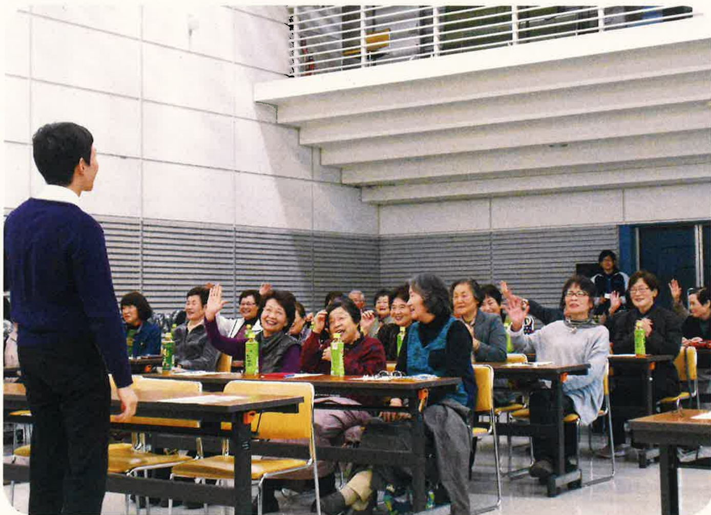
平成27年度給食ボランティア研修会