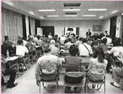
5月から6月にかけて、町内各地区で開催いたしました福祉推進員及び近隣ボランティア研修会にご参加いただき、ありがとうございました。

そこで、地域の誰もが安心して暮らせるように、地域の皆さんが見守り活動等とおし、地域の問題や福祉課題を共有し、連携し