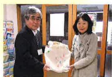
不破高等学校の皆さんから高齢者の方にと手作りの手さげ袋をいただきました