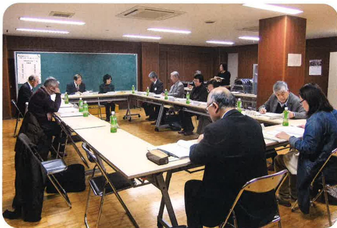
垂井町地域福祉活動計画策定委員会

「ささえあいと絆の福祉のまち たるい!」の実現をめざして、垂井町社会福祉協議会は、地域の皆さんとともに、ささえあいと絆のしくみによる、誰もが安心して暮らせるまちづくりをすすめます。※準備がととのい次第、皆さんに活動計画のダイジェスト版をお届けいたします。