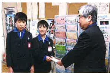
社会福祉に役立ててくださいと寄付金をお持ちいただいた垂井小学校の児童さん