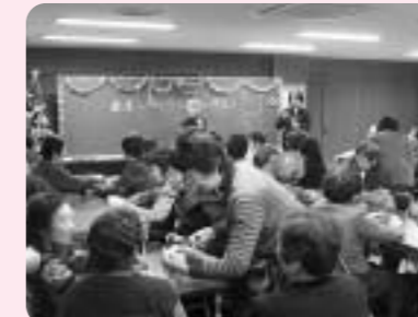
歳末いきいきふれあいサロン