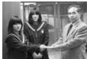
福祉に役立ててくださいと寄付金をお持ちいただいた不破中の生徒さん