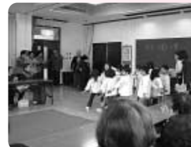
岩手地区民生委員によるつどい