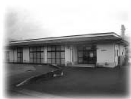
生きがいセンター外観