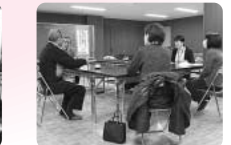
在宅介護者のつどい