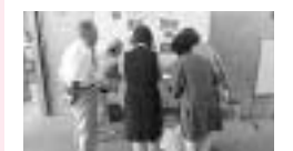
東地区生きがいサロンの開催 など