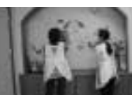
高齢者施設の訪問 など