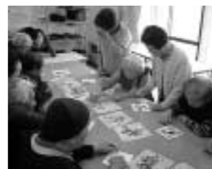
きれいな作品ができました