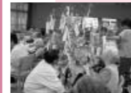
願いをこめて 七夕さま