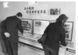
海外戦跡慰霊巡拝の写真やアルバムをご覧になる参列者

2月5日(土)、垂井町文化会館にて平成22年度垂井町戦没者追悼式が行われました。 厳粛の中、ご来賓の方々による追悼の辞が読み上げられた後、参列者による献花が行われました。 戦没者のご冥福をお祈りすることもに平和への誓いを新たにしました。 当日は厚生労働省の「海外戦跡慰霊巡拝事業」に遺族の方々に参加されたときの様子などを撮影した写真パネルやアルバムが展示されました。 当日式場に訪れた参列者の方々へ、ご遺族が亡くなられた異国の地の現在の写真を探し出しては、感慨深いご覧になっていました。