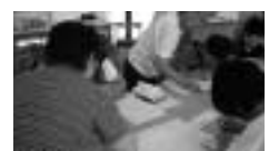
視覚障がい者のガイドヘルパーなど