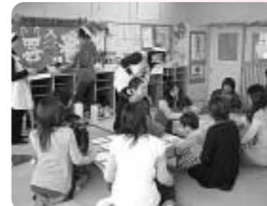
子育てふれあいサロン クリスマス会

また、歳末たすけあい募金は、高齢者、障がい者、子育て等の幅広い事業に使わせていただきました。