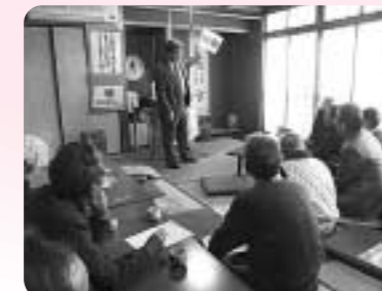
平尾ふれあいサロン