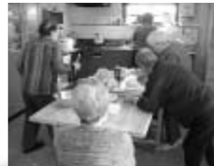
みんなで昼食の準備