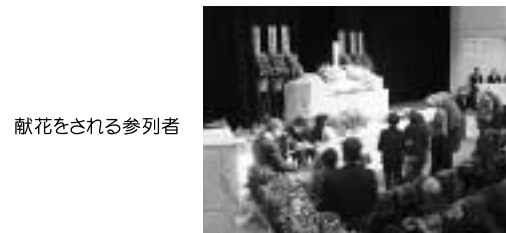
献花をされる参列者