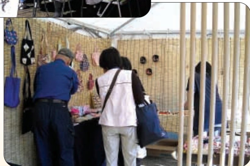
「けやきの家」 布製小物を展示販売