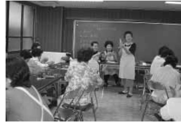
福祉会館でのサロン

地域のみなさんと一緒にお茶を楽しみながら、お話ししませんか。各地区でいきいきふれあいサロンが開催されています。