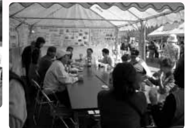
一杯のお茶から会話に花が咲きます