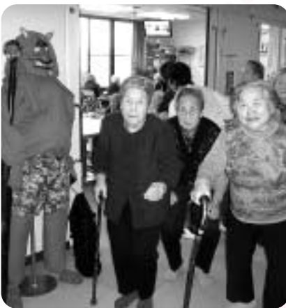
節分行事に赤鬼さんがお迎え