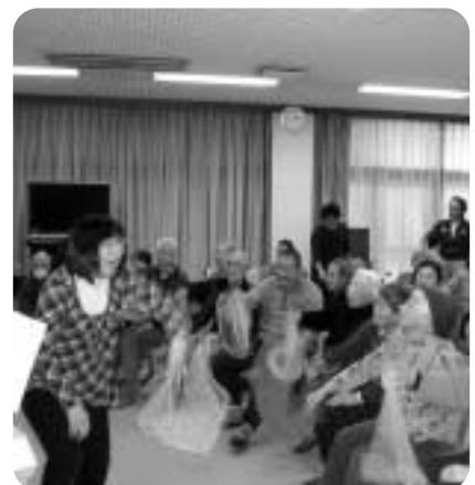
みんなで昔なつかしい歌を(音楽療法を楽しむ)