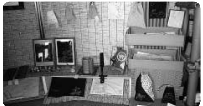
小物のいろいろみてください