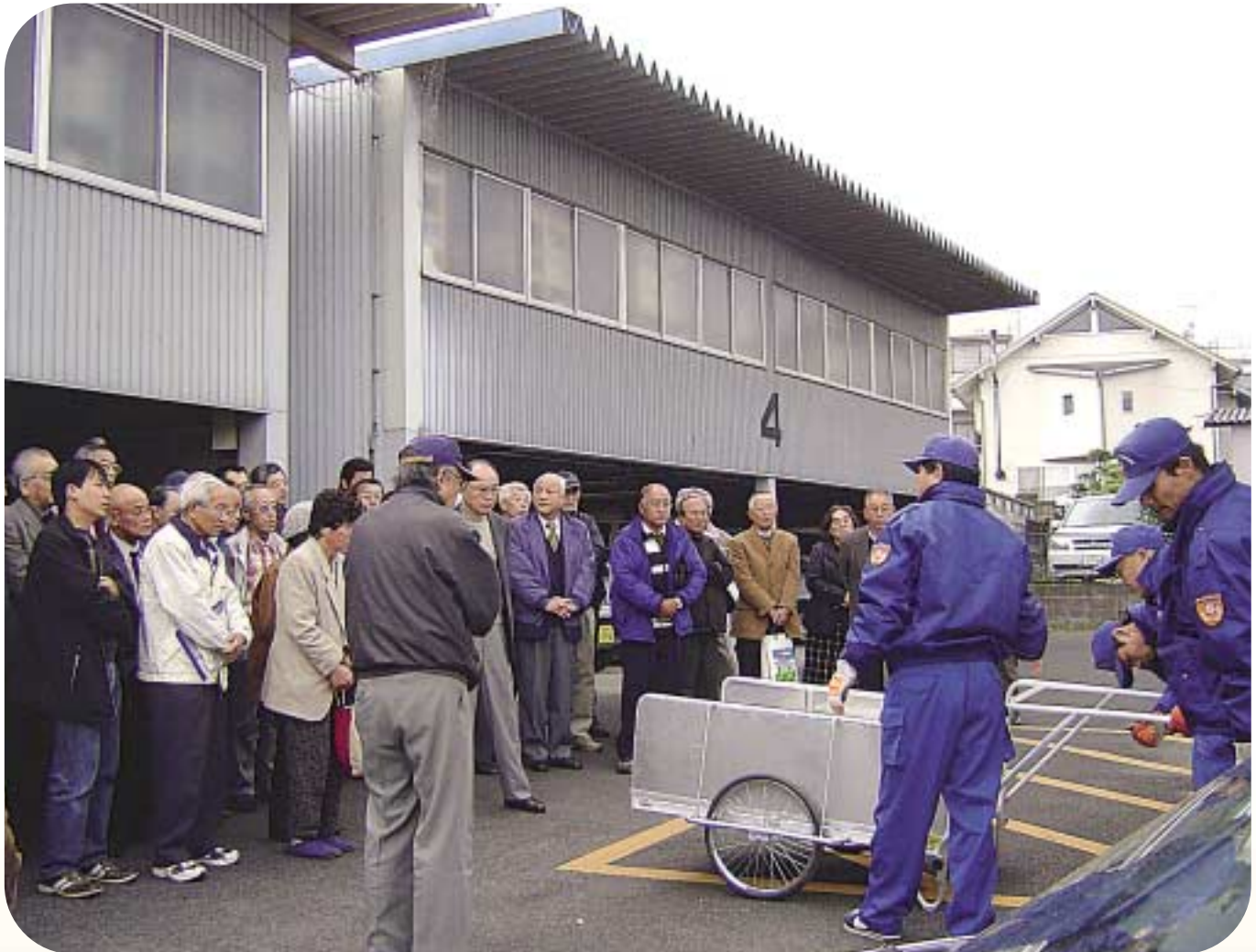
災害用器具取り扱い説明を熱心に聞く参加者