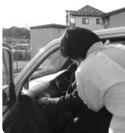
今日は少しおそく送らせていただきます