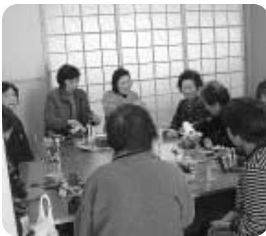
野田で開かれたサロン

住んでいる地域に愛着をもち、よさを見直し、よりよくなるよう支えあって、ボランティア活動の輪を広げましょう。