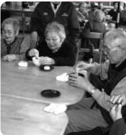
野点を楽しむ おいしいねお茶一服