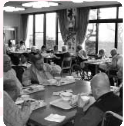
みんなで楽しい食事