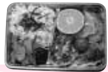
手作り弁当(給食ボランティア)