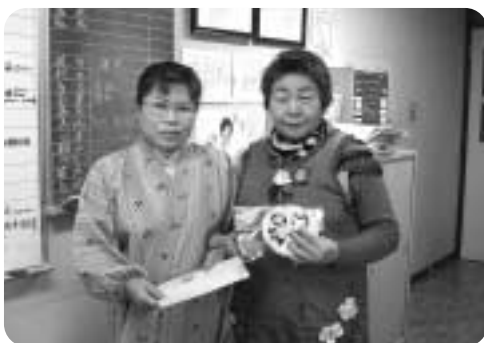
手作りの贈り物ありがとう

垂井町商工会から寝たきり高齢者の方へと、手作りミニ壁飾り31名分が贈られました。社会福祉協議会では、寝たきり高齢者にお届けしました。とてもかわいらしい贈り物に、高齢者の方にもっこり、あたたかい気分になっていただけました。