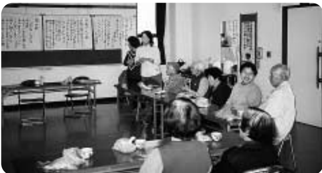
府中地区(府中公民館で)