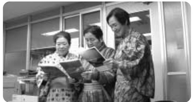
童心にかえて楽しみましょう(名づけて かえるの合唱団)