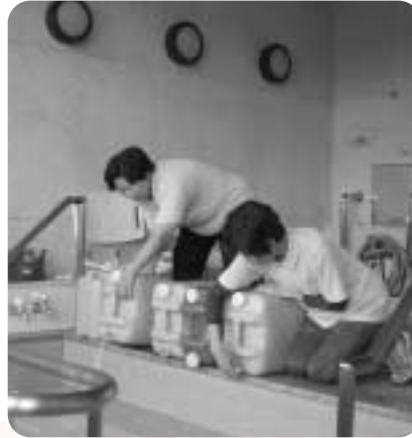
月に1週間朝倉温泉湯を