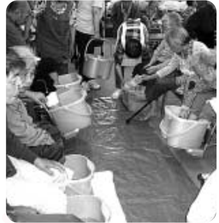
足湯で体ホカホカ