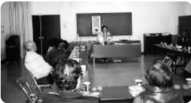
岩手地区(岩手公民館で)