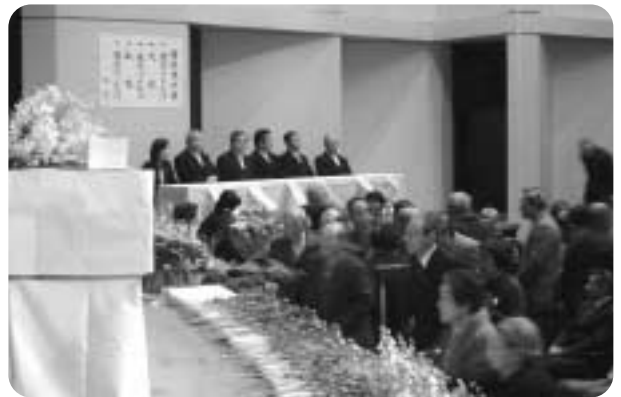
献花される参列者のみなさん

平成19年度垂井町戦没者追悼式は、2月9日(土)に垂井町文化会館で行われました。 約250名のご遺族や関係者のご参列のもとに“あの悲惨な状況は今なお消えない悲しみ、恒久平和を祈りたい”と戦争で亡くなられた多くの方のご冥福を祈りました。