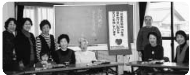
宮代地区(宮代公民館で)