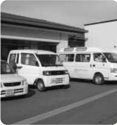
ご利用者のお迎えに出発