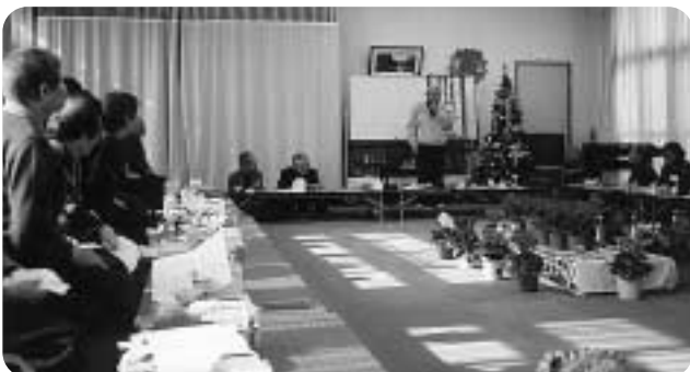
垂井地区(生きがいセンターで)