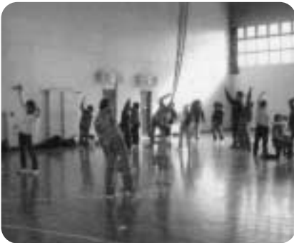
こいのぼり交流会