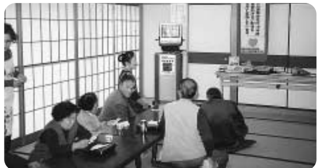
表佐地区(表佐公民館で)