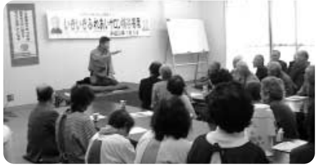
梅谷で開かれたサロン