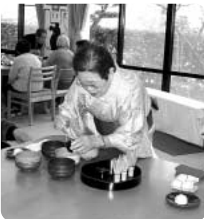
ボランティアによる野点