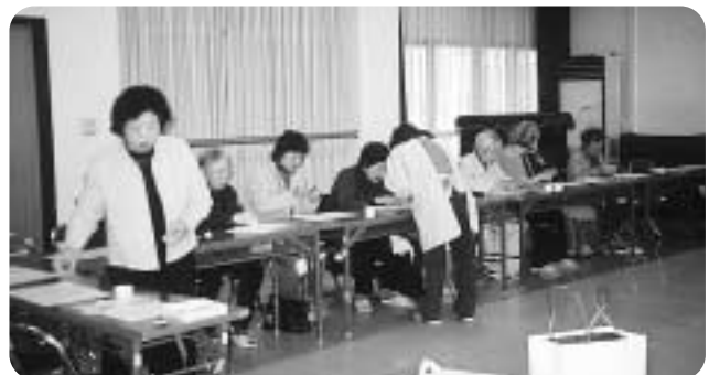
東地区(農村婦人の家で)